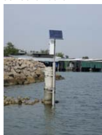
sonda di Caleri