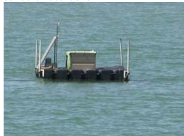
sonda di Scardovari