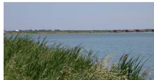
Delta del Po