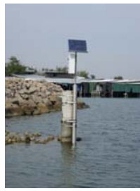
sonda di Caleri