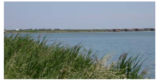
Delta del Po