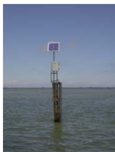
sonda di Basson