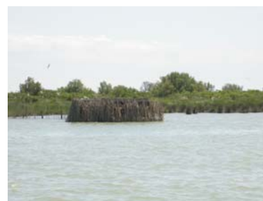
Delta del Po – laguna Basson