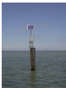
sonda di Basson