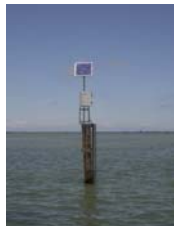
sonda di Basson