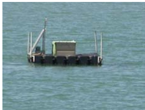
sonda di Scardovari