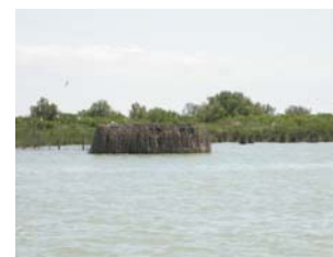
Delta del Po – laguna Basson