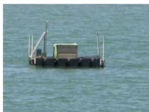
sonda di Scardovari