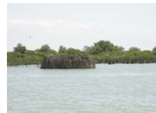
Delta del Po – laguna Basson