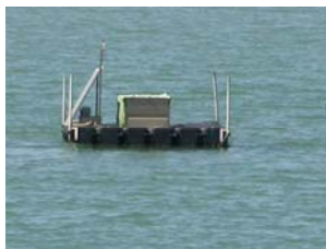
sonda di Scardovari