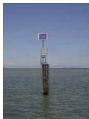
sonda di Basson