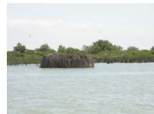
Delta del Po – laguna Basson