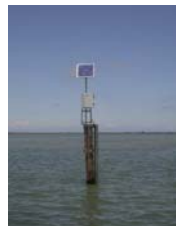
sonda di Basson